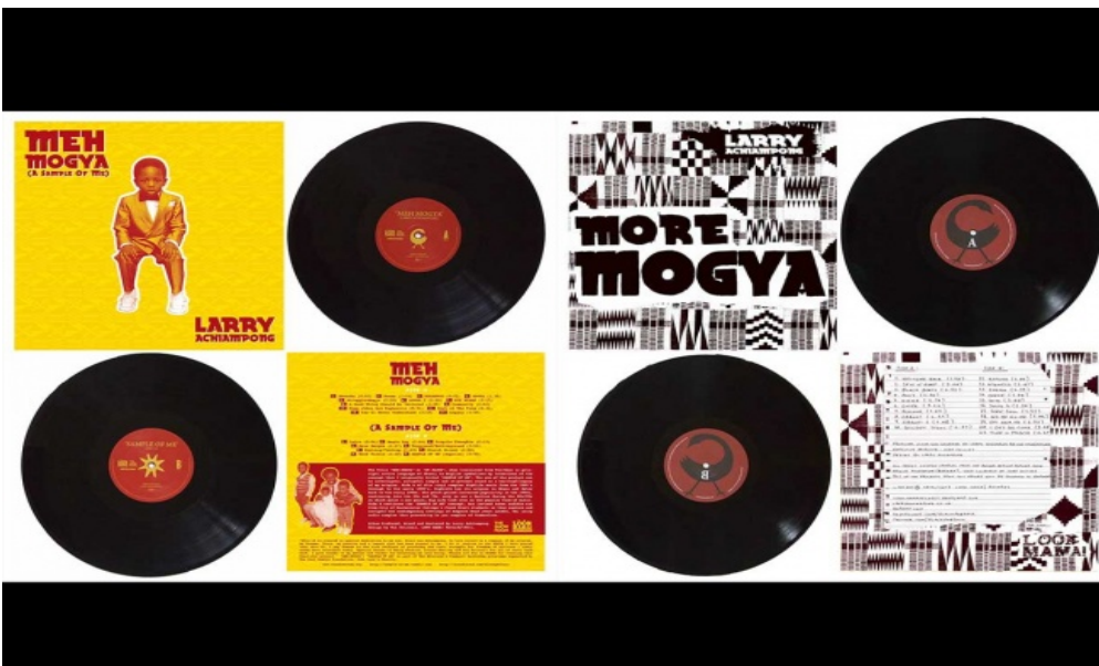
Opere di Larry Achiampong.