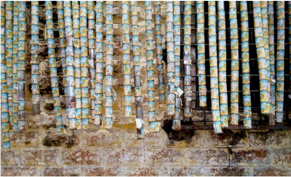
Opere di Kwame Asante Agyare.