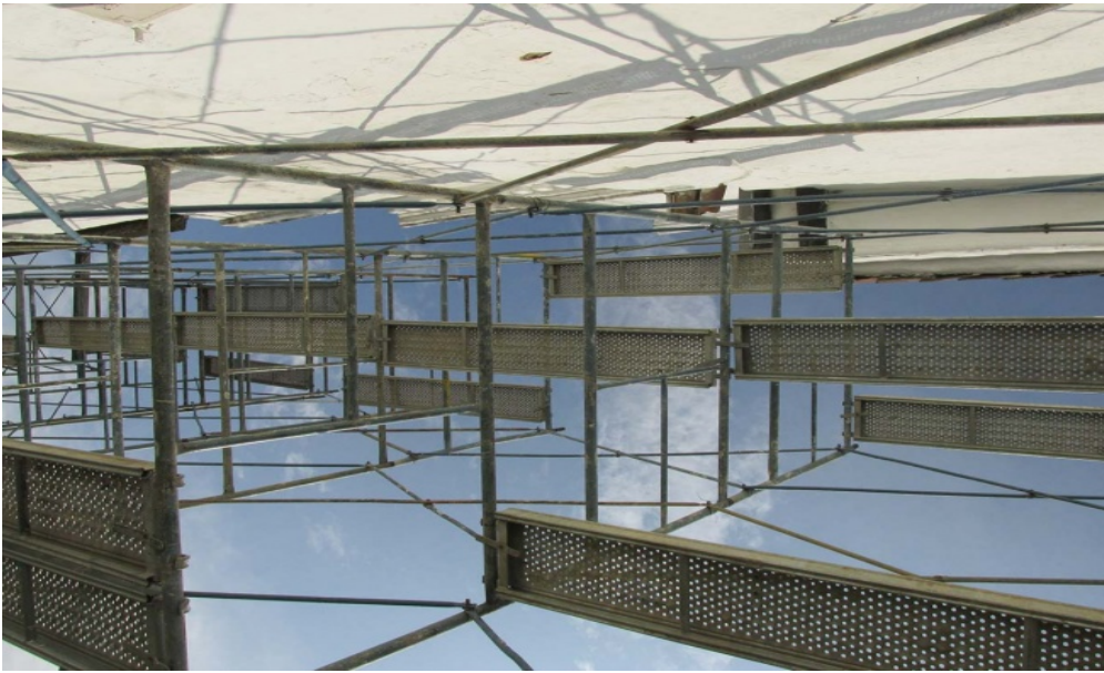
Opere di Kwasi Ohene-Ayeh.