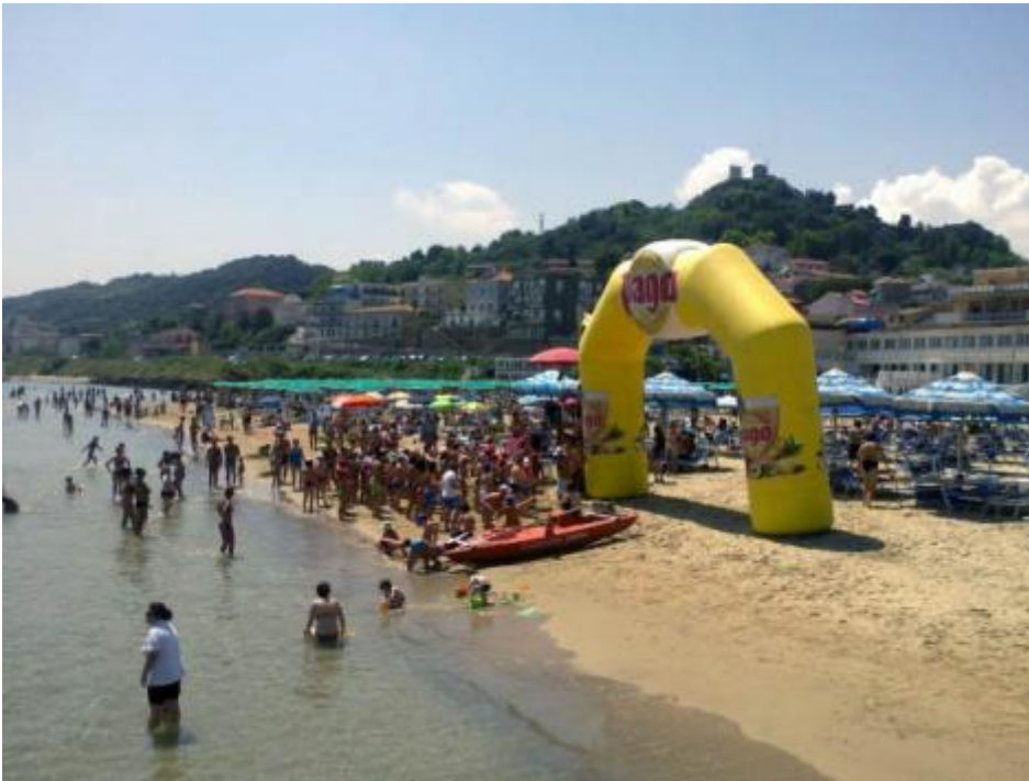
Calypso al Lido