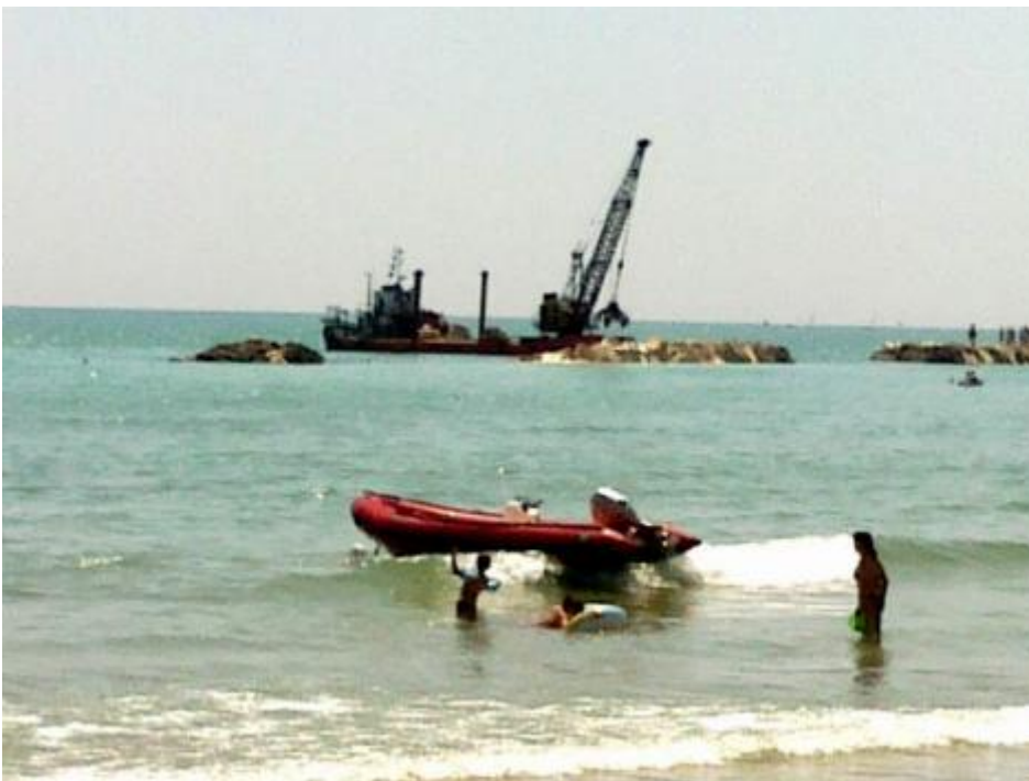
Orizzonte in costruzione