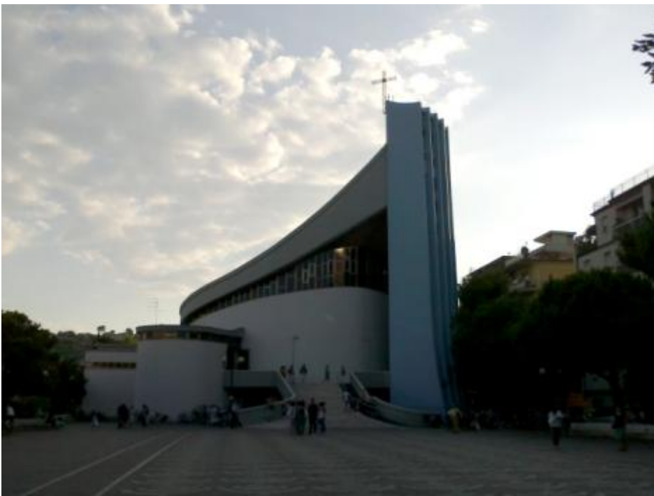
Un trampolino ai fedeli del Molise