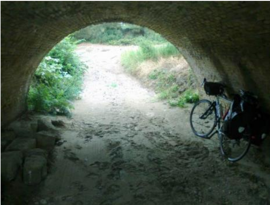
Proprio sotto ad un ponte