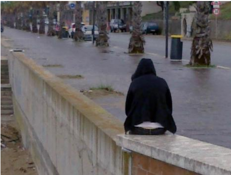
La malinconia a Termoli