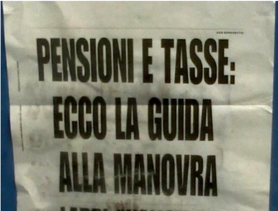
Ecco la guida