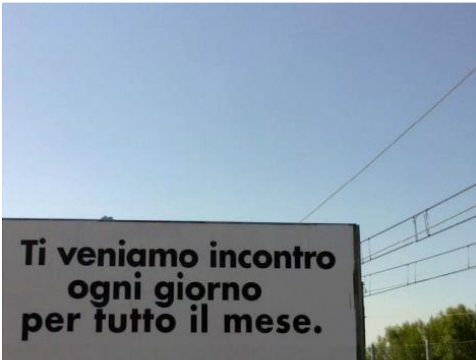
Ogni giorno per tutto il mese