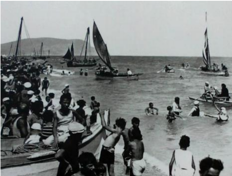
Oggi più di ieri.