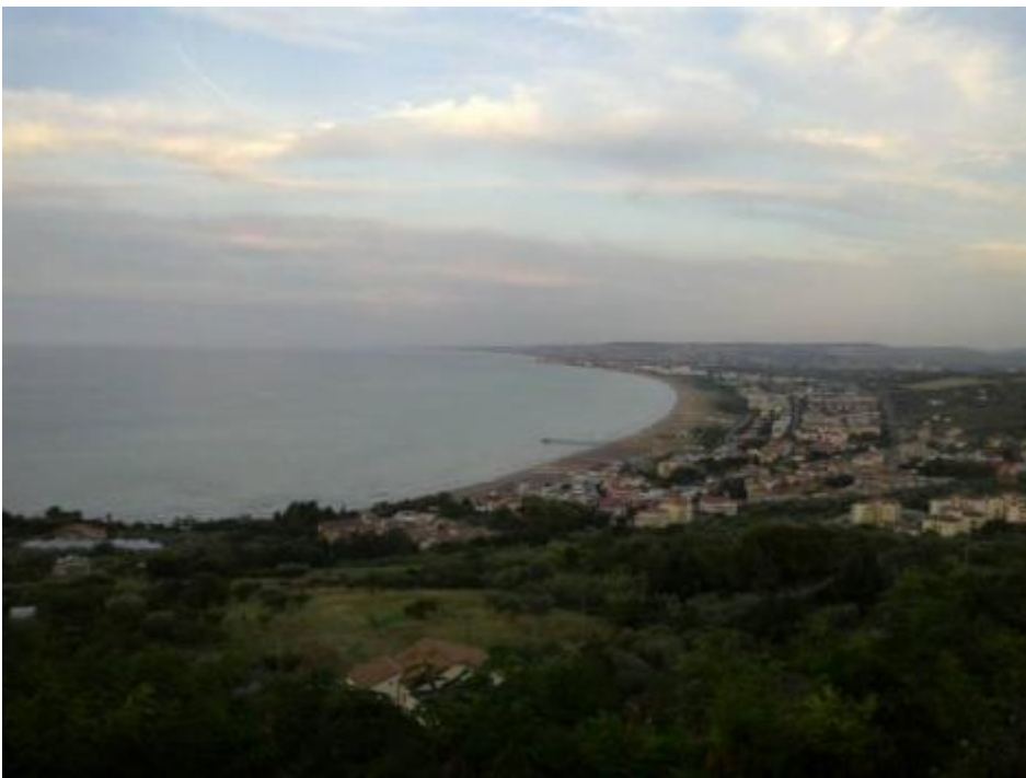
Fermo. E mi fermo.