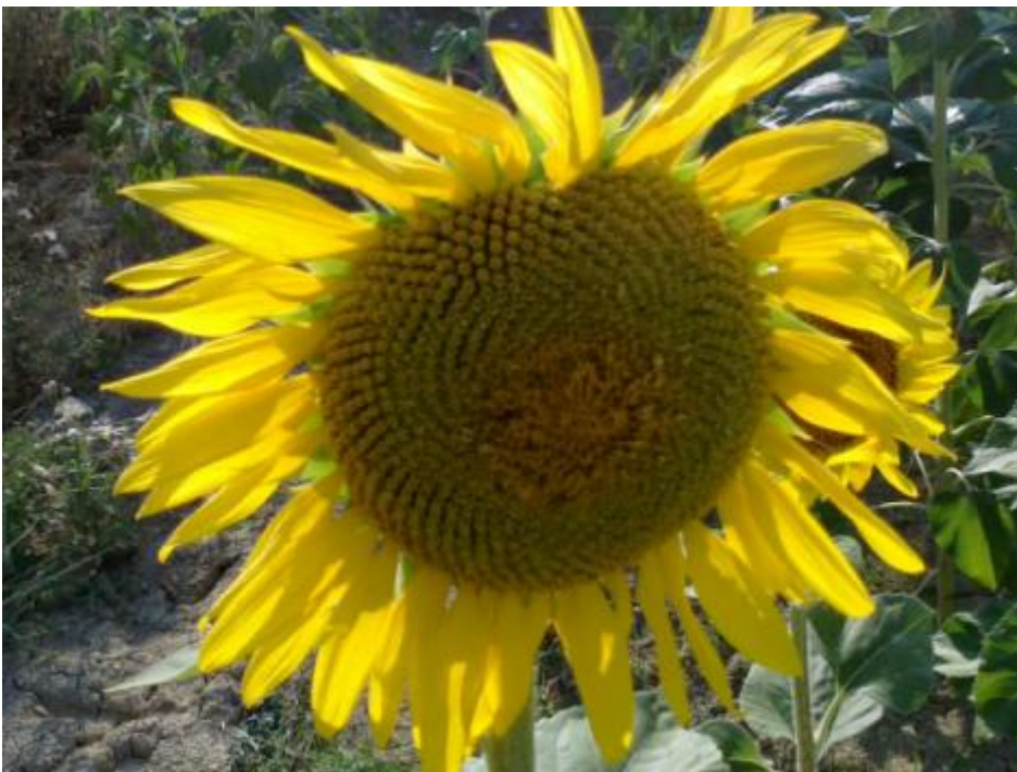
Se girasse il sole.