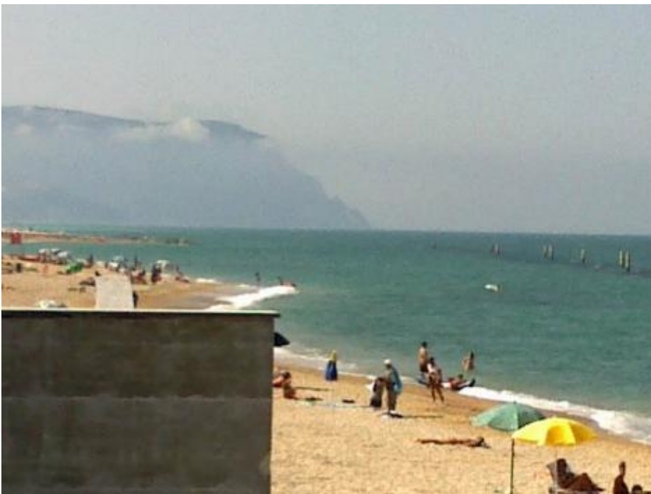
Il Conero dietro a un muro.