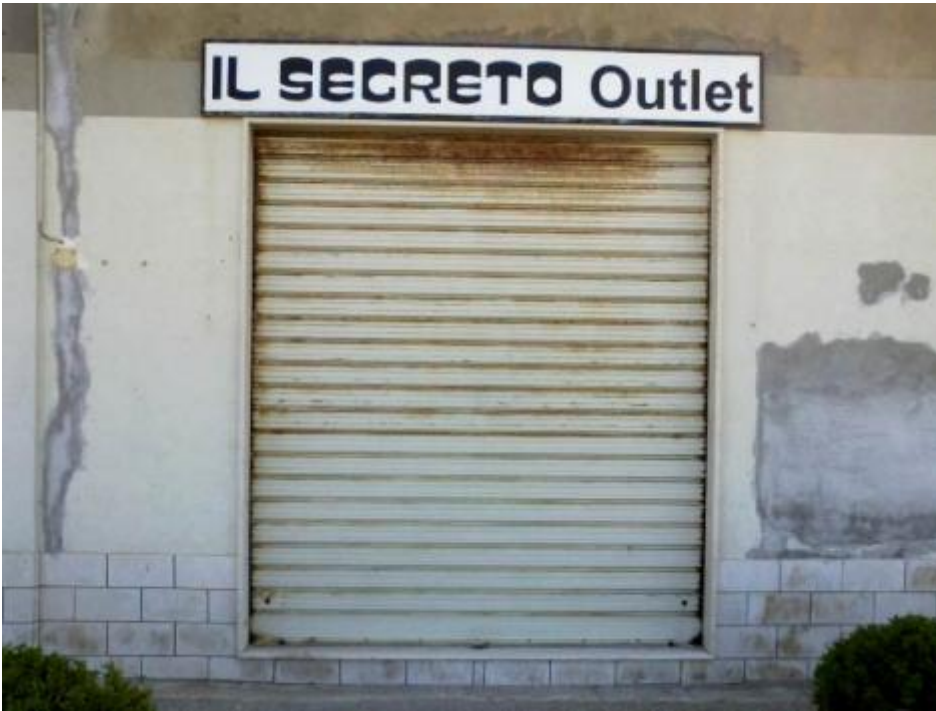
Il segreto di Riva Verde.