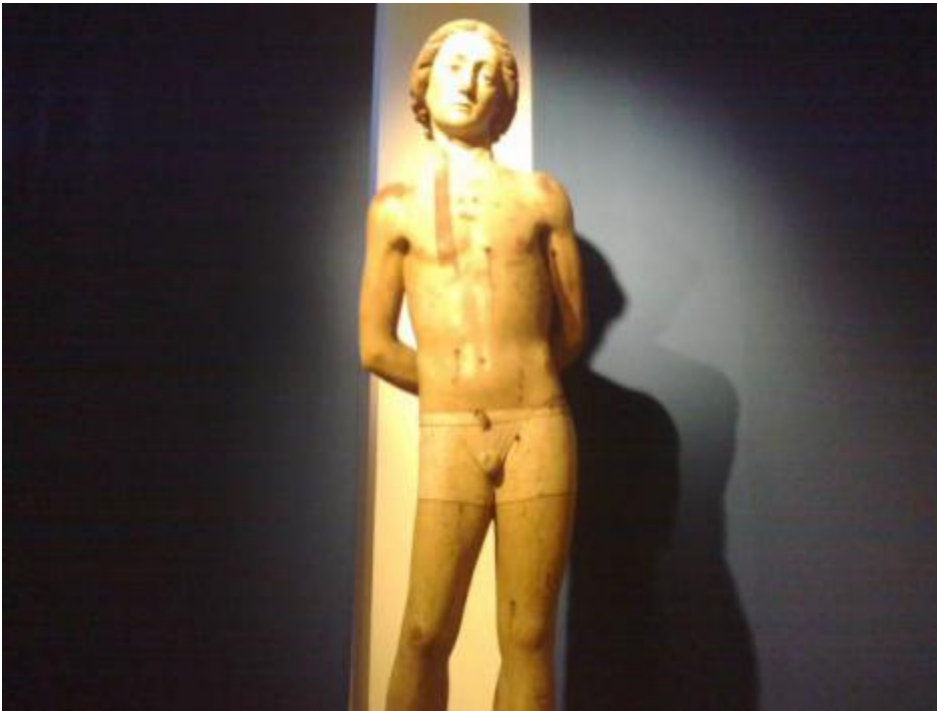
A Fermo i boxer di San Sebastiano.