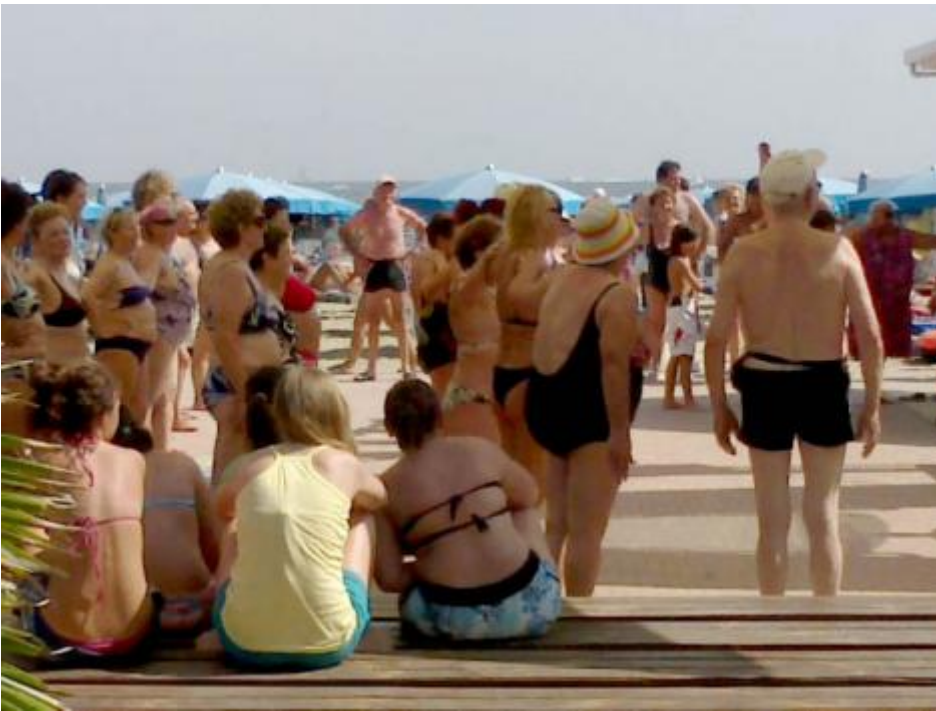
La riviera di mattina.