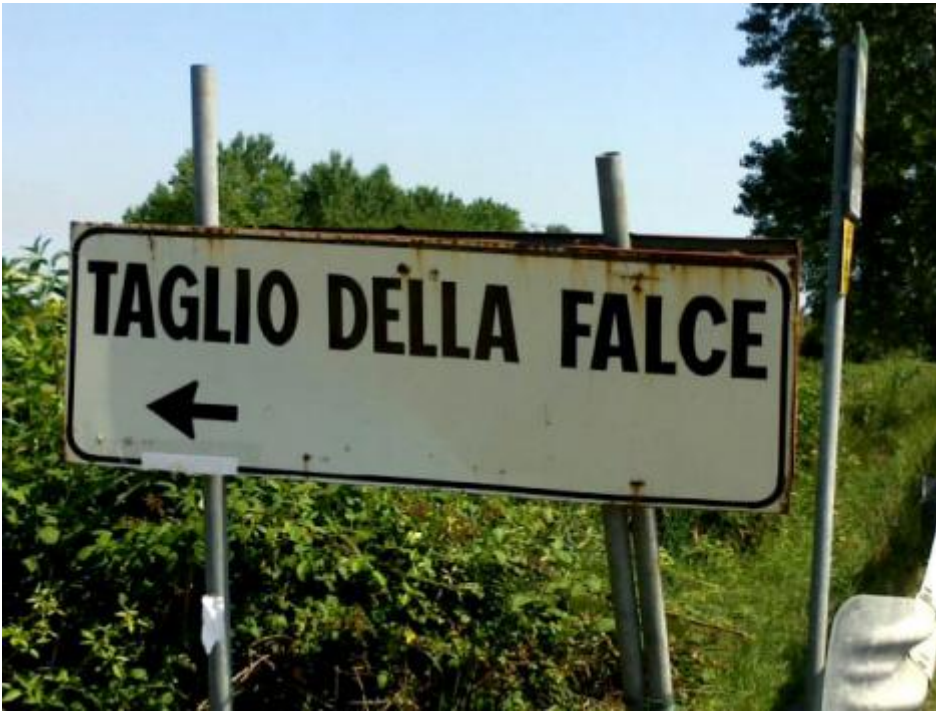
Taglio della falce.