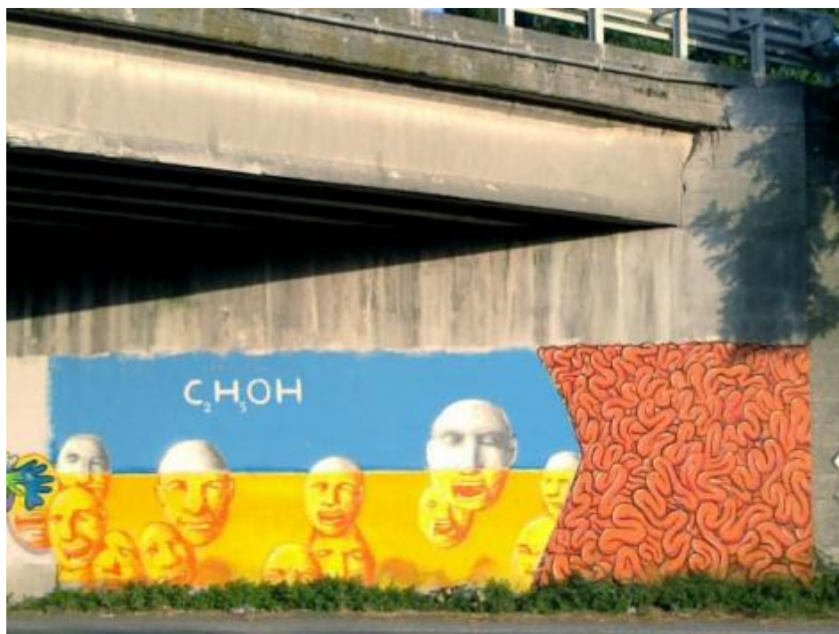
CHOH. A Marina di Ravenna.

Continua Orizzonte in Italia , il giro in bicicletta lungo le coste della nostra penisola: questa tappa ci porta in Emilia Romagna.