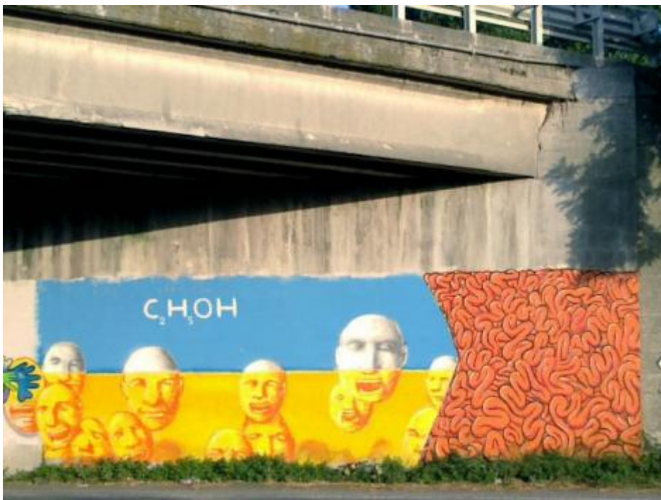
CHOH. A Marina di Ravenna.

Continua Orizzonte in Italia , il giro in bicicletta lungo le coste della nostra penisola: questa tappa ci porta in Emilia Romagna.