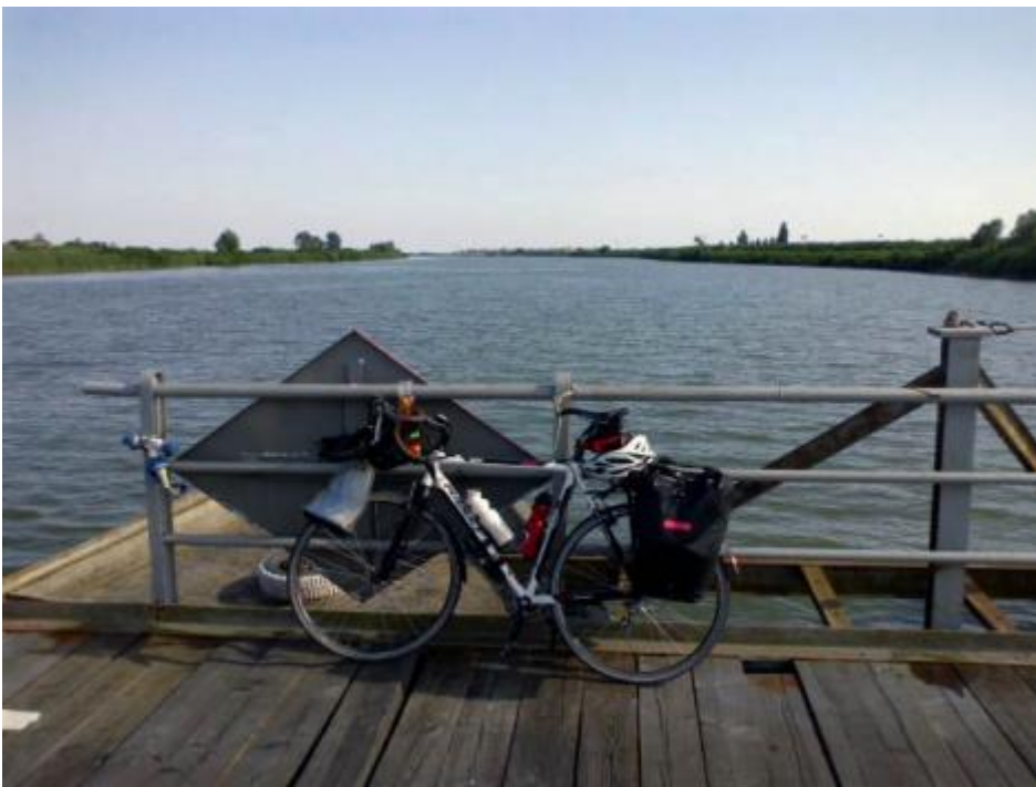
Tra la Romagna e il Veneto un ponte di barche.