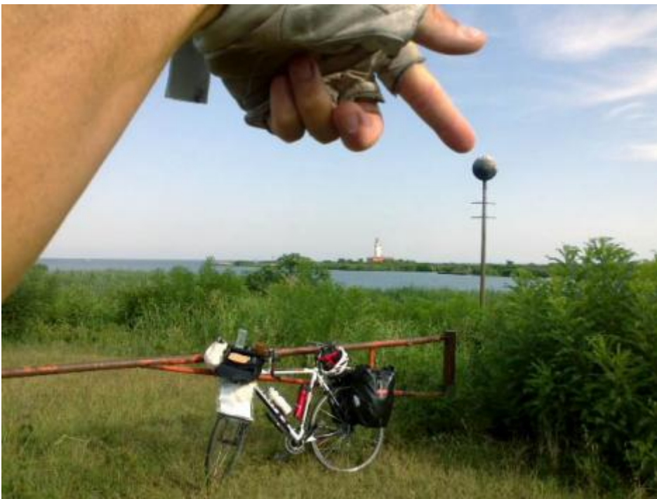
Ritrovare il punto nella foce.