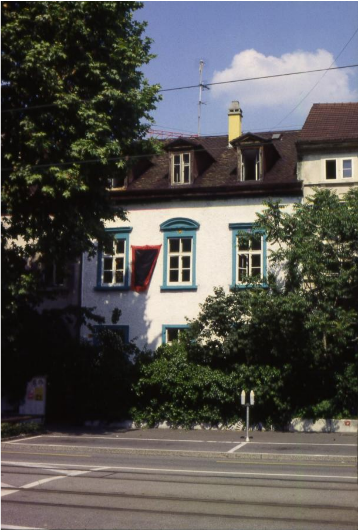
Liberi tutti! (Basilea) , 1996, itinerario nei luoghi del pensiero libertario, bandiera cm 180x130, courtesy L. Vitone