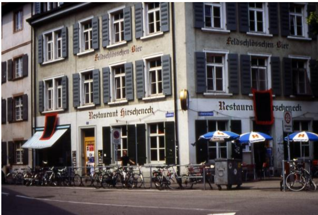
Liberi tutti! (Basilea), 1996, itinerario nei luoghi del pensiero libertario, bandiera cm 180x130, courtesy L. Vitone

Ma l'oggetto della scultura col susseguirsi dei decenni si è rivelato più vario coinvolgendo ambiti disciplinari altrui come la matematica, la fisica, la geografia, la speculazione filosofica, o utilizzando materiali come il cibo, il suono, l'immagine in movimento (video o pellicola) e arrivare appunto alla passeggiata, l'itinerario e quindi il camminare.