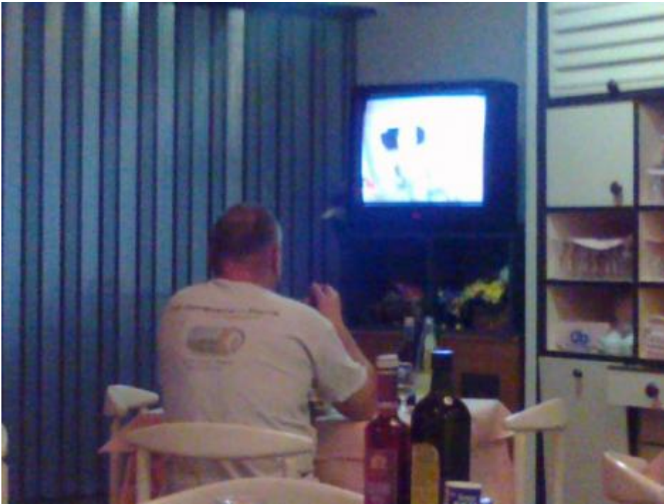
Scherzi a parte ad Aquileia.