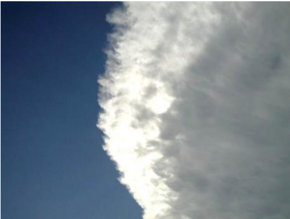
Grande Cirro friulano.