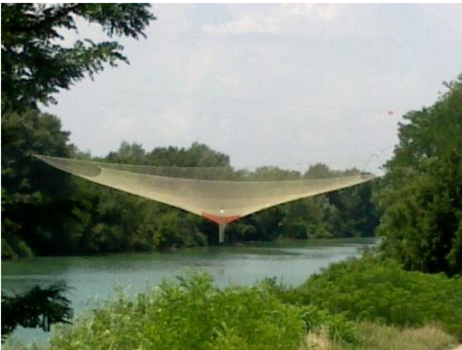
Una rete al centro.