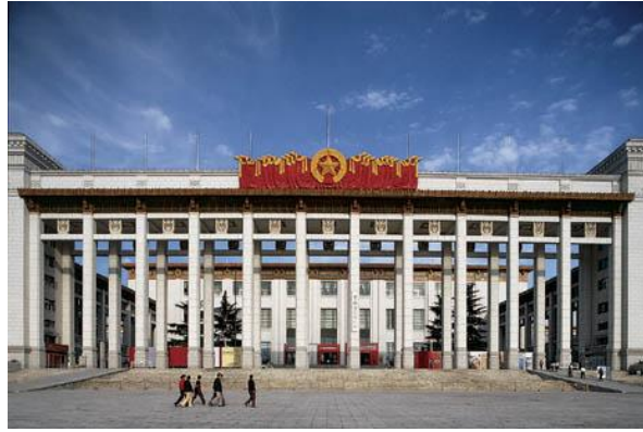
Museo della Rivoluzione Cinese, Pechino.

La necessità di costruire nasce da un bisogno primario: realizzare un rifugio nel senso fisico del termine; tuttavia con lo sviluppo delle civiltà umane essa è diventata il tentativo di affermare una visione del mondo, sia quando si tratta di una singola casa sia di palazzi o grattacieli. Fra un sindaco che invita un architetto a progettare un edificio, o un nuovo complesso abitativo, esiste un rapporto differente tra quello che s'instaura tra lo stesso architetto e gli inquilini che vi dovranno abitare. Difficile trovare un dittatore, da Mussolini a Kim Il Sung, che una volta raggiunto il potere non si sia impegnato in una serie di costruzioni. E la cosa riguarda anche i grandi capitalisti americani, come mostra la storia di Nelson Rockefeller.