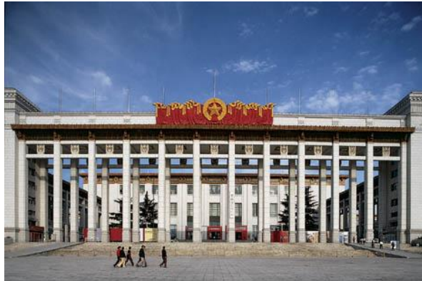
Museo della Rivoluzione Cinese, Pechino.

La necessità di costruire nasce da un bisogno primario: realizzare un rifugio nel senso fisico del termine; tuttavia con lo sviluppo delle civiltà umane essa è diventata il tentativo di affermare una visione del mondo, sia quando si tratta di una singola casa sia di palazzi o grattacieli. Fra un sindaco che invita un architetto a progettare un edificio, o un nuovo complesso abitativo, esiste un rapporto differente tra quello che s'instaura tra lo stesso architetto e gli inquilini che vi dovranno abitare. Difficile trovare un dittatore, da Mussolini a Kim Il Sung, che una volta raggiunto il potere non si sia impegnato in una serie di costruzioni. E la cosa riguarda anche i grandi capitalisti americani, come mostra la storia di Nelson Rockefeller.