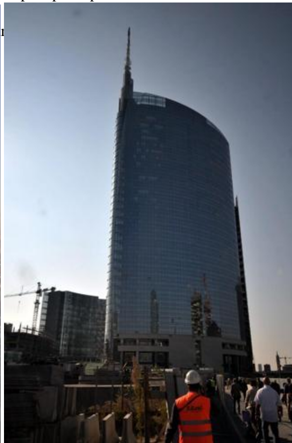
La torre di Cesar Pelli, Milano.