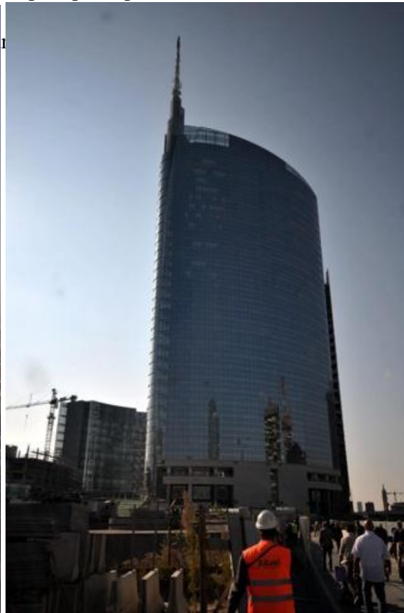
La torre di Cesar Pelli, Milano.