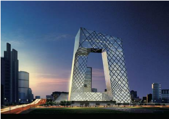
China Central Television, Pechino.

confronto Koolhaas con Zhang Kaiji, il progettista del Museo della Rivoluzione, finito a riflettere durante la Rivoluzione culturale, per dieci lunghi anni, sul suo lavoro di architetto mentre spazzava pavimenti. L'architettura, conclude, serve a definire un regime, ma non sono quasi mai gli architetti a formularne il significato.