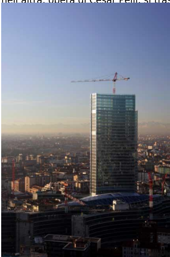
La torre di Henry Cobb, Milano.

Si fronteggiano a breve distanza, meno di un chilometro in linea d'aria. Il primo ha la forma di due grandi parentesi contrapposte nella parte convessa, una più alta e una più bassa; il secondo è invece una sorta di nastro di vetro che si srotola partendo da una cuspide posta più in alto. Si tratta delle nuove torri milanesi. In quella edificata su progetto di Henry Cobb ha sede la Regione Lombardia, nell'altra, opera di Cesar Pelli, si trasferirà tra poco UniCredit, la più grande banca