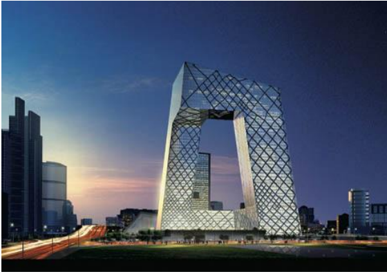
China Central Television, Pechino.