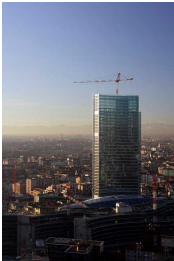
La torre di Henry Cobb, Milano.

Si fronteggiano a breve distanza, meno di un chilometro in linea d'aria. Il primo ha la forma di due grandi parentesi contrapposte nella parte convessa, una più alta e una più bassa; il secondo è invece una sorta di nastro di vetro che si srotola partendo da una cuspidate posta più in alto. Si tratta delle nuove torri milanesi. In