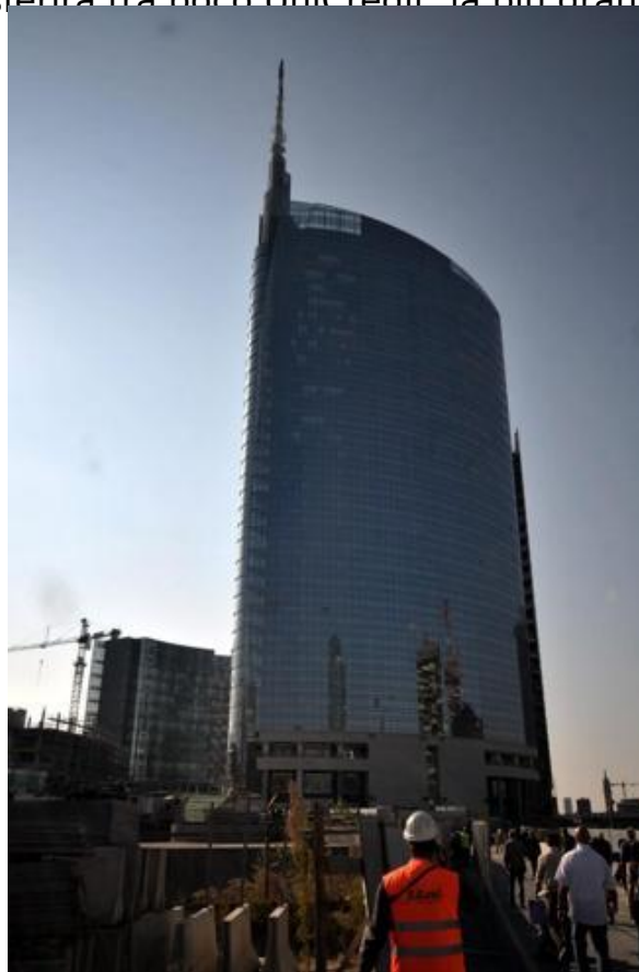
La torre di Cesar Pelli, Milano.